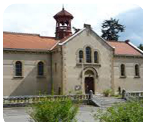
Musée des sciences médicales Livre Grenoble Métropole Santé, 2020

- mettre en valeur la belle histoire du site Santé et son patrimoine dans une amicale complicité de pensée et d'action entre l'AGRUS et le Musée grenoblois des sciences médicales ( MGSM)