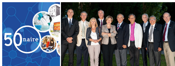
Les membres fondateurs

Adhérer à l'AGRUS c'est se tenir informé et partager des moments de convivialité !