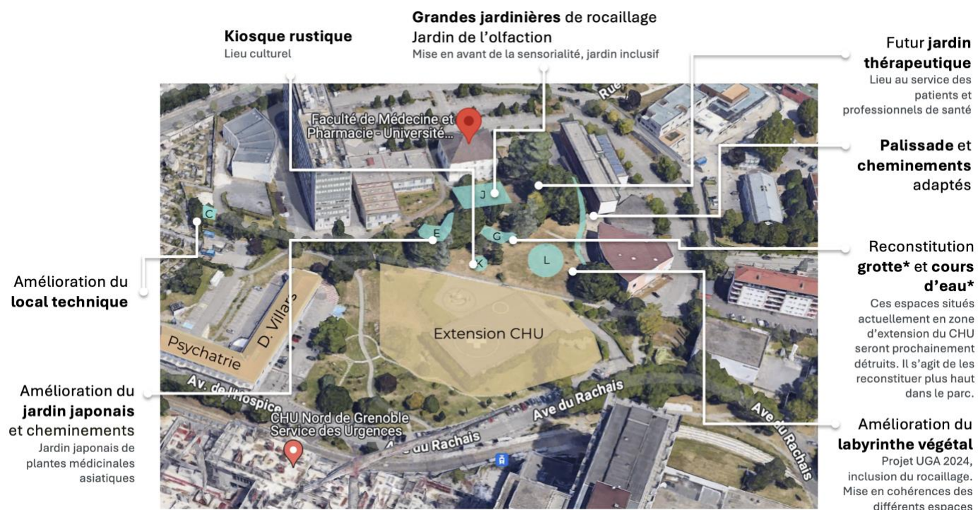
Vue aérienne du site du campus santé, présentation des différents projets en lien avec ROCA-BOTA

Roca-Bota est un projet qui se distingue par l'implication de la formation au cours des recherches et conceptions. Plusieurs étudiants et alternant de l'université se verront confier des missions de recherche : Histoire, Histoire de l'Art, Pharmacie mais aussi Gestionnaires.