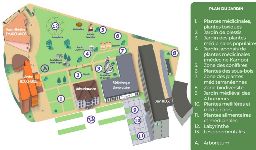
Plan actuel du jardin Dominique Villars avec les différentes sections thématiques

Le jardin est par ailleurs ouvert à tous et toutes, gratuitement, toute l'année : étudiants, personnels, patients, passants, riverains... De nombreux événements de médiation culturelle et scientifique ainsi que des visites guidées sont présentés. Ainsi le jardin est au service de plusieurs entités relevant de la qualité de vie et de la responsabilité sociétale . Ceci en valorisant également le patrimoine culturel et scientifique , la formation , la conservation botanique et l' inclusivité sur le site du campus santé de l'UGA.