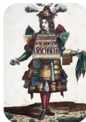
Habit de parfumeur, musée Carnaval

INCLUSIVITÉ : C'est le maître mot des futurs projets d'aménagement au jardin D. Villars. Cheminements et affichages adaptés, App avec descriptions audio, sculptures à toucher sont autant d'aménagements prévus pour une accessibilité totale.