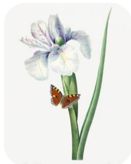
Iris d'Espagne, Redouté

Le projet ROCA-BOTA prévoit également l'installation de collections thématiques de :