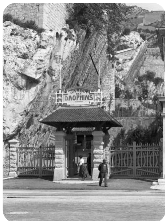
Jardin des Dauphins à Grenoble, lieu de rocaille au XIX e

La Rocaille est un art décoratif évoquant la nature , inspiré par les éléments rocheux et les grottes, puis élargi au bois avec l'avènement des ciments prompts. Ce style fleurit entre la Renaissance et le XX e siècle, mais a décliné avec son industrialisation.